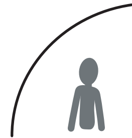
Dagelijks leven (7)

De nummers 1 tot en met 7 corresponderen met de beschrijvingen in De metafoor van de Vuist . De metafoor van de Vuist - Overlevingsmechanismen bij dissociatieve delen is verkrijgbaar via www.dis-is-me.nl/doneren