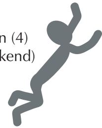
Vluchten (4) (Vertrekkend)